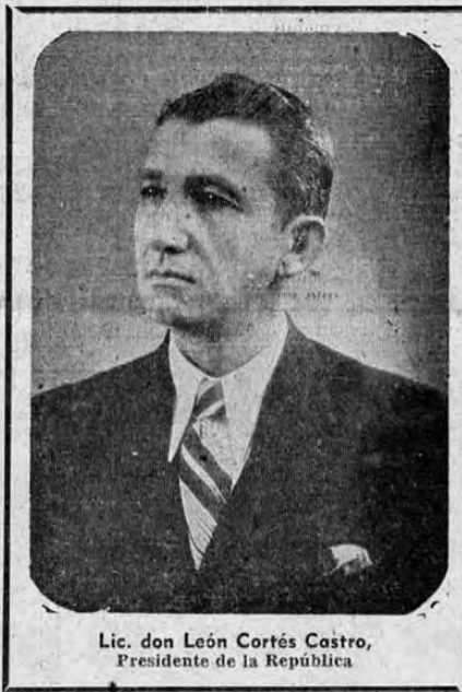
Lic. don León Cortés Castro, Presidente de la República